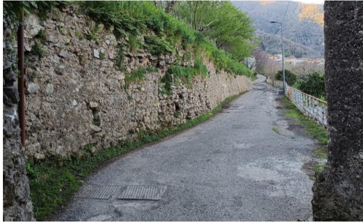
Foto n. 4 Strada oggetto di intervento